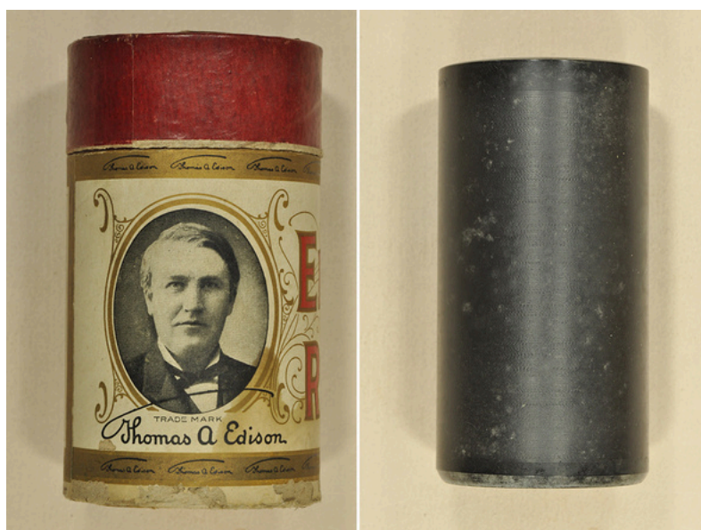
Des cylindres phonographiques

« Les cylindres phonographiques sont peu propices à la conservation sur le temps long. Faits d'une matière sensible aux changements de température et d'humidité, ils ont une forme qui les rend particulièrement fragile à la manipulation. Enfin, chaque écoute d'un cylindre sur un phonographe use les sillons gravés lors des enregistrements. Leur numérisation était donc devenue nécessaire, afin à la fois de permettre un accès aux chants qu'ils contiennent, mais également d'en préserver le contenu en voie de disparition. » Marie-Alice Le Corvec, archiviste au CRBC